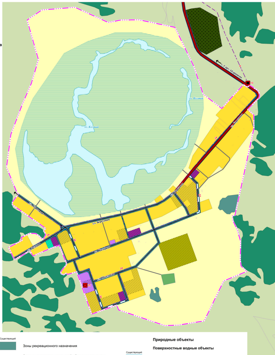
СХЕМА РАСПОЛОЖЕНИЯ НАСЕЛЕННОГО ПУНКТА В ГРАНИЦАХ САФАКУЛЕВСКОГО МУНИЦИПАЛЬНОГО ОКРУГА