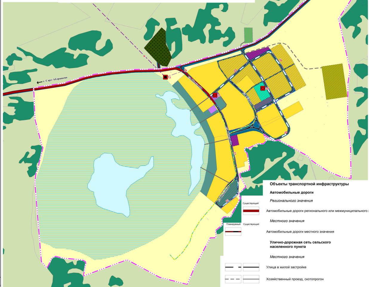
СХЕМА РАСПОЛОЖЕНИЯ НАСЕЛЕННОГО ПУНКТА В ГРАНИЦАХ САФАКУЛЕВСКОГО МУНИЦИПАЛЬНОГО ОКРУГА