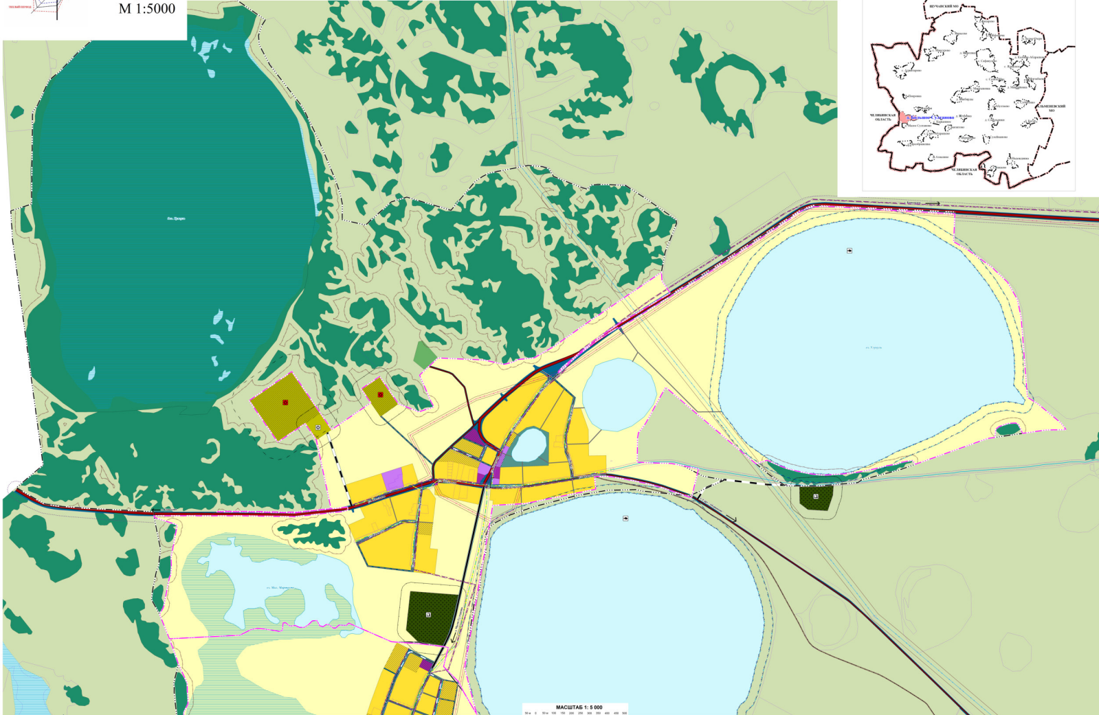
СХЕМА РАСПОЛОЖЕНИЯ НАСЕЛЕННОГО ПУНКТА В ГРАНИЦАХ САФАКУЛЕВСКОГО МУНИЦИПАЛЬНОГО ОКРУГА