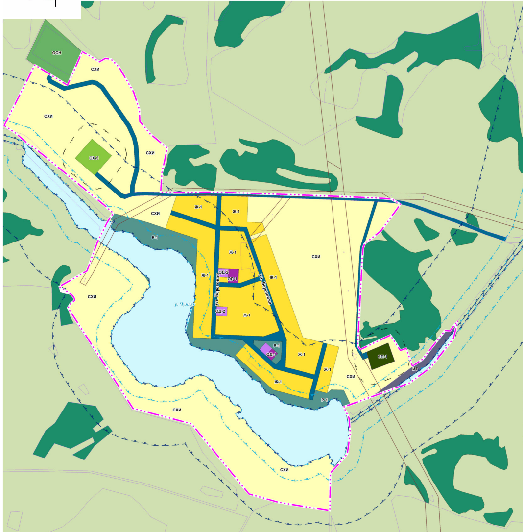
СХЕМА РАСПОЛОЖЕНИЯ НАСЕЛЕННОГО ПУНКТА В ГРАНИЦАХ САФАКУЛЕВСКОГО МУНИЦИПАЛЬНОГО ОКРУГА